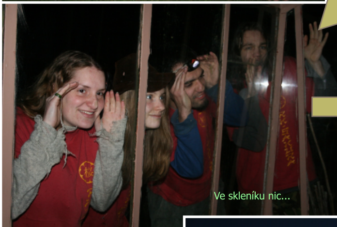
Ve skleníku nic...