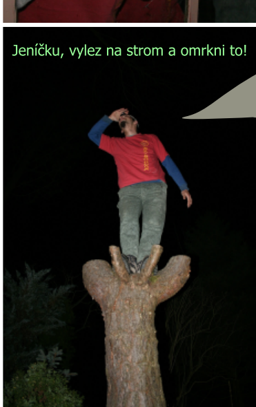
Jeníčku, vylez na strom a omrkní to!