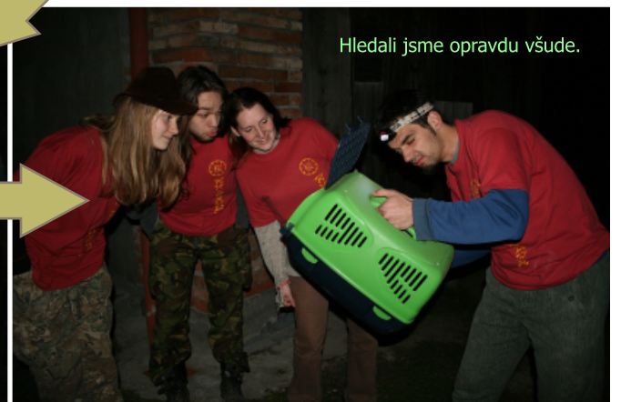
Hledali jsme opravdu všude.