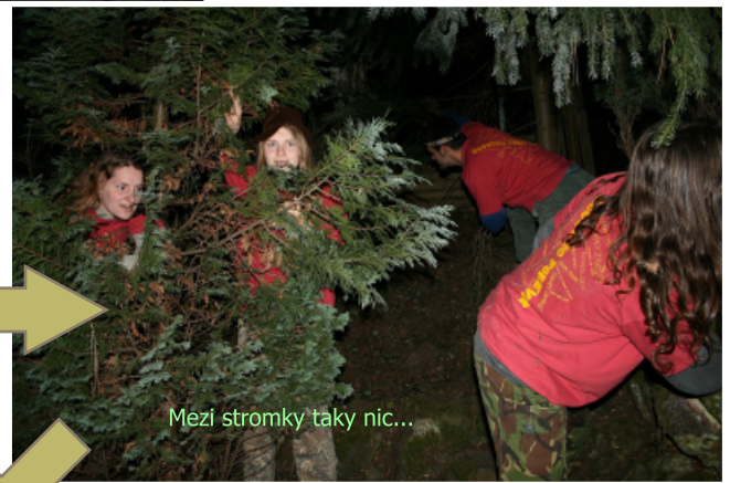
Mezi stromky taky nic...